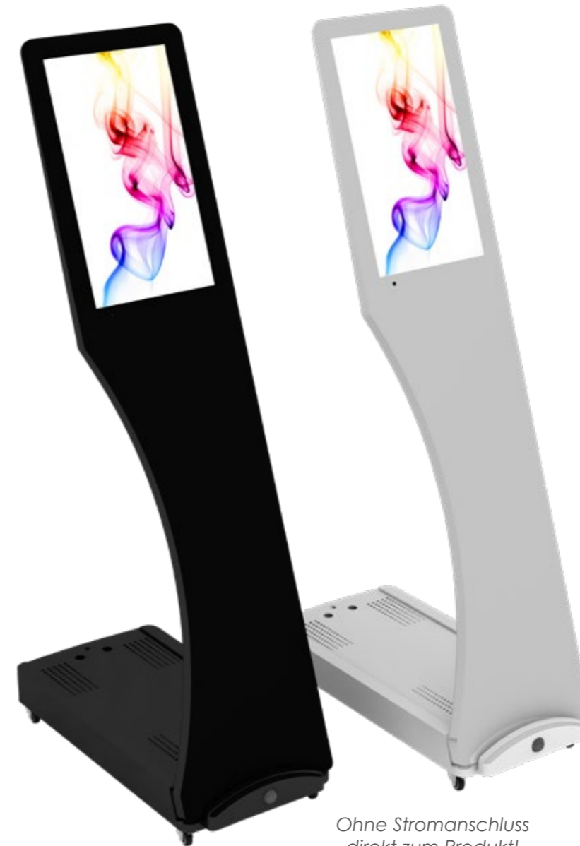
Ohne Stromanschluss direkt zum Produkt!

Auf Wunsch kann über die integrierten Lautsprecher auch Ton abgespielt werden.