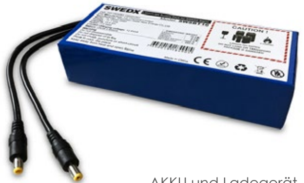
AKKU und Ladegerät